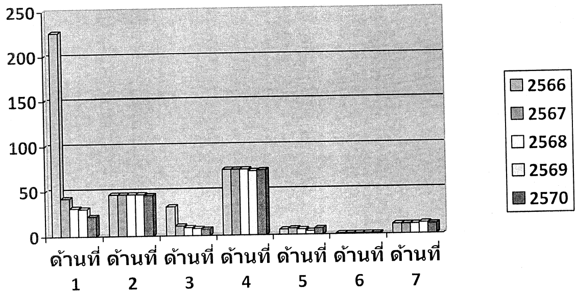
ตารางที่ ๓ จำนวนโครงการตามยุทธศาสตร์การพัฒนาแยกเป็นรายปี